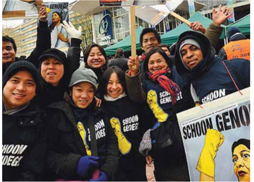
DOMESTIC WORKERS VOEREN ACTIE VOOR EEN BETERE SCHOONMAAK-CAO

Het werk van de Domestic Workers is nu relatief veilig en ze kunnen er aardig aan verdienen. Problemen ontstaan pas als de vrouwen