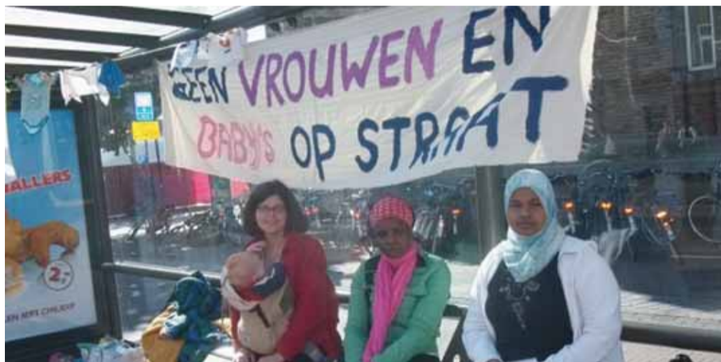
IN EEN UTRECHTS BUSHOKJE VOEREN VROUWEN ACTIE TEGEN HET OP STRAAT ZETTEN VAN KINDEREN

De uitspraak kwam voor de minister op een ongelukkig moment: net op 1 januari 2010 zouden de noodopvangcentra voor uitgeprocedeerde asielzoekers gesloten moeten worden. Met het pardon hadden veel bewoners een status gekregen, andere bewoners werden begin 2010 overgenomen door AZC's en door de Vrijheidsbeperkende Locatie in Ter Apel. Toegeven dat er nog steeds gezinnen met kinderen op straat belanden, en daarmee ook dat noodopvang nog steeds nodig zou zijn, kwam de minister dan ook niet goed uit.